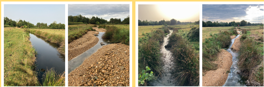
Travaux de recharge granulométrique sur l’Anglin amont

Les programmes d’actions des bassins versants de la Creuse, de l’Anglin et de la Claise seront désormais réunis sous un contrat unique : le Contrat Territorial de la Creuse et de ses affluents dans l’Indre pour une période 2024-2026.